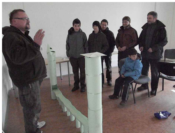
4 tátové a 5 synů