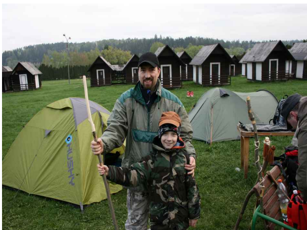
10 tátů a 11 synů