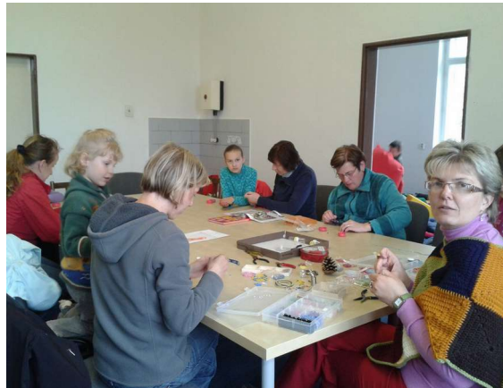
Hraní s korálky – Vánoční perníčky