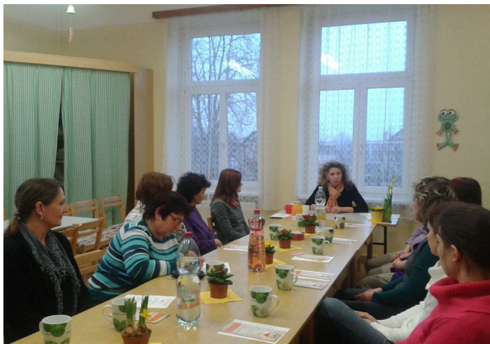
Partnerský vztah, co mi říká o mně – Děti a náš vztah k nim

Pořadí sourozenců v rodině – Vyrovnaný vztah s rodiči, jako základ spokojeného života